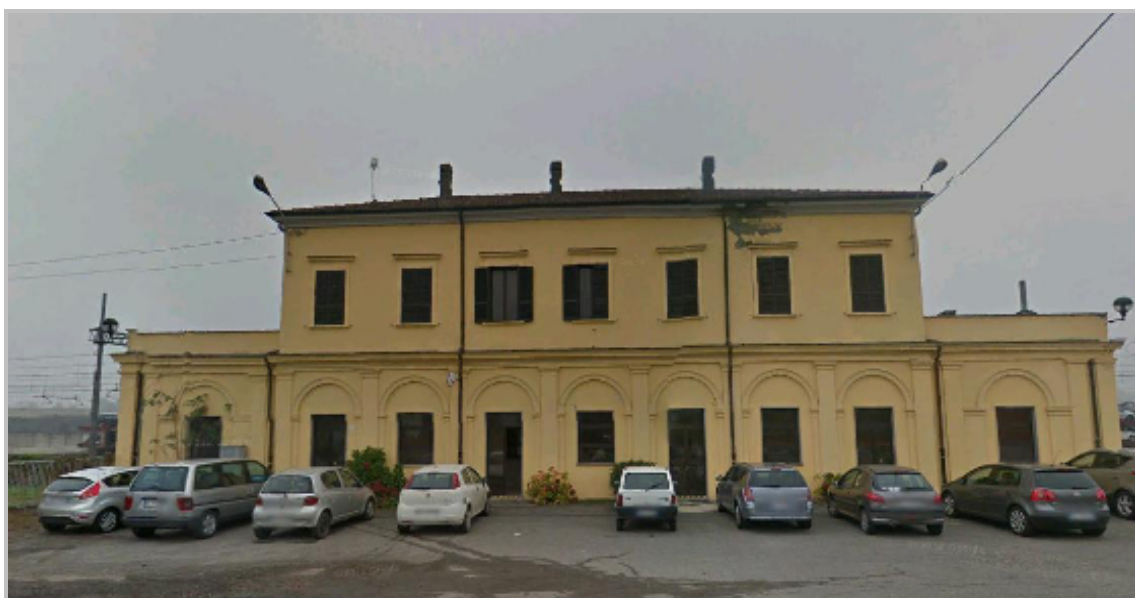
Figura 4 Stazione ferroviaria di Arena Po (immagine estratta da Google earth)

Sul territorio di Arena Po, Bosnasco, Zenevredo, Portalbera e San Cipriano Po, sono stati rilevati due punti di accessibilità: la fermata ferroviaria di Arena Po, posta sulla linea Alessandria-Stradella-Piacenza e una elisuperficie omologata situata in frazione Fabbrica ad Arena Po.