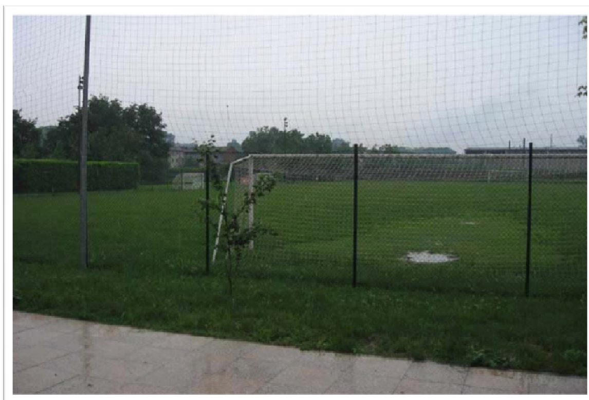
Figura 3 Il campo sportivo di Arena Po