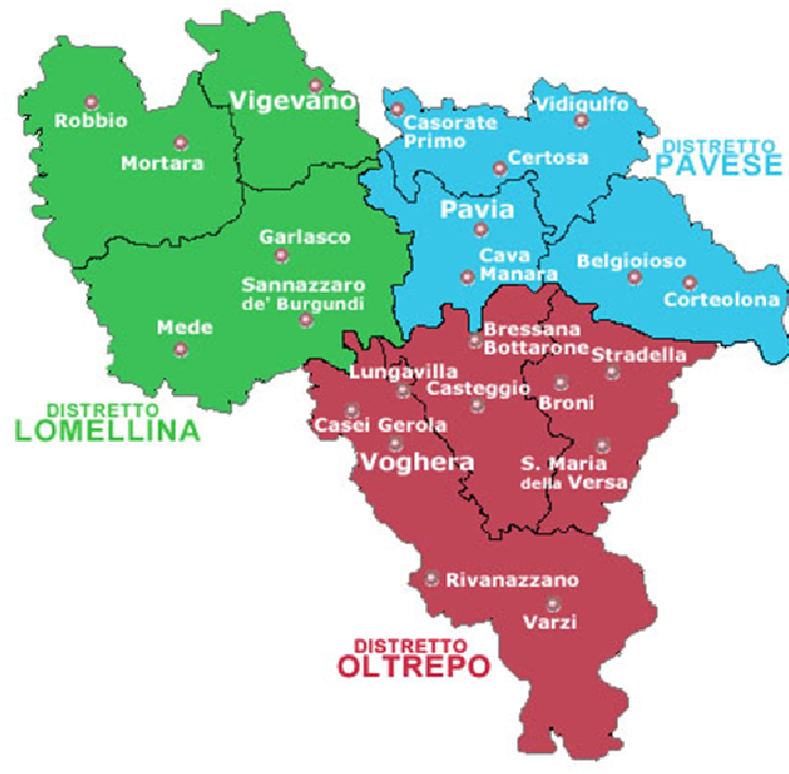
Figura 5 I distretti sanitari dell'ASL di Pavia

Le risorse di ogni Distretto sono suddivise tra diverse figure professionali tra cui medici, psicologi, infermieri, assistenti sanitari, ostetriche, terapisti della riabilitazione, assistenti sociali, operatori di vigilanza, educatori professionali, personale amministrativo e sono organizzate e gestite dal Direttore di Distretto.