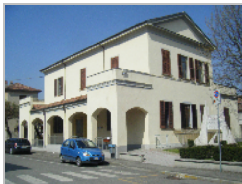
Figura 2 Il Dispensario di Zenevredo e il Municipio, dove ha sede anche l'ambulatorio medico, a destra la scuola materna di Portalbera