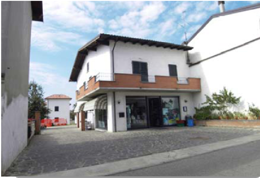
Figura 74 La farmacia di Bosnasco