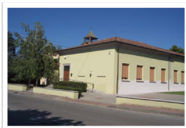
Figura 1 Il Municipio di Arena Po e l'edificio polifunzionale a Bosnasco